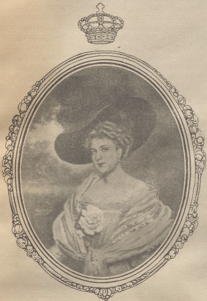
S. M. LA REINA VICTORIA EUGENIA